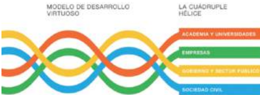
GRÁFICO 3 | Modelo de desarrollo territorial ‘cuádruple hélice’