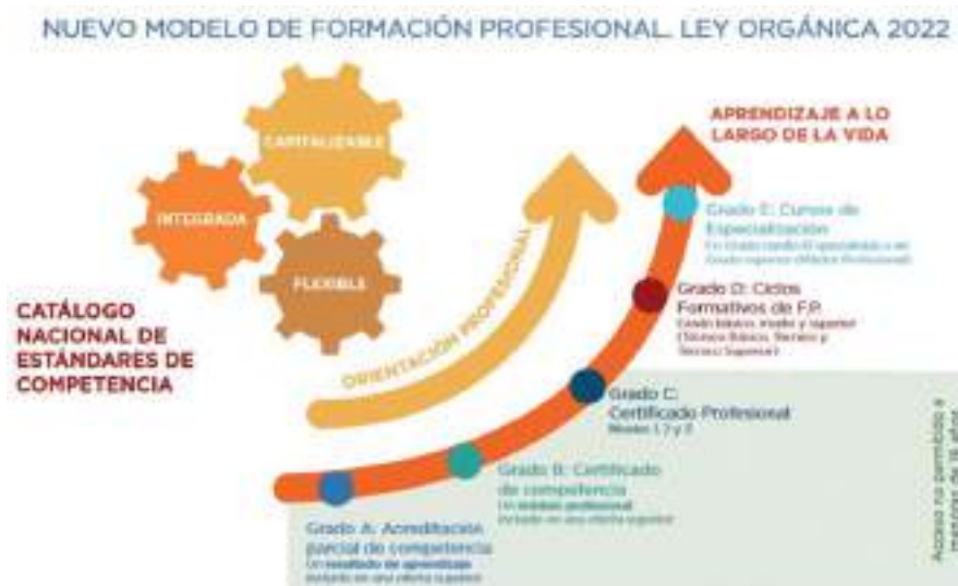
GRÁFICO 2 | Nuevo modelo de formación profesional