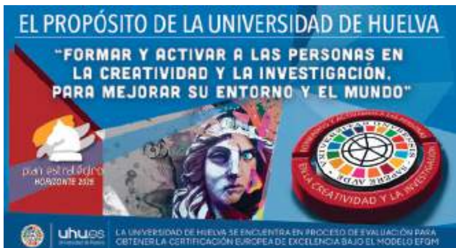
GRÁFICO 4 | Propósito de la Universidad de Huelva.

FUENTE: www.uhu.es , consulta a 8-9-2024.