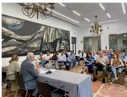
Pleno del Consejo Económico y Social de la Provincia de Huelva (CESpH) DIPUTACIÓN DE HUELVA

El CES de la provincia de Huelva abordará seminarios sobre la Inteligencia Artificial y el Hidrógeno verde