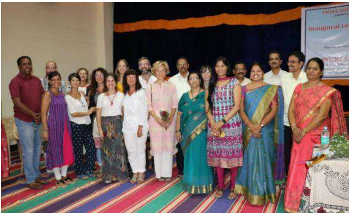
Trabajo en terreno de clases de alemán en el voluntariado en la India de la FVF, 2019.

El proceso de selección incluye, además de la revisión de la documentación presentada, la realización de una entrevista personal a quienes han solicitado participar en el programa de voluntariado internacional.