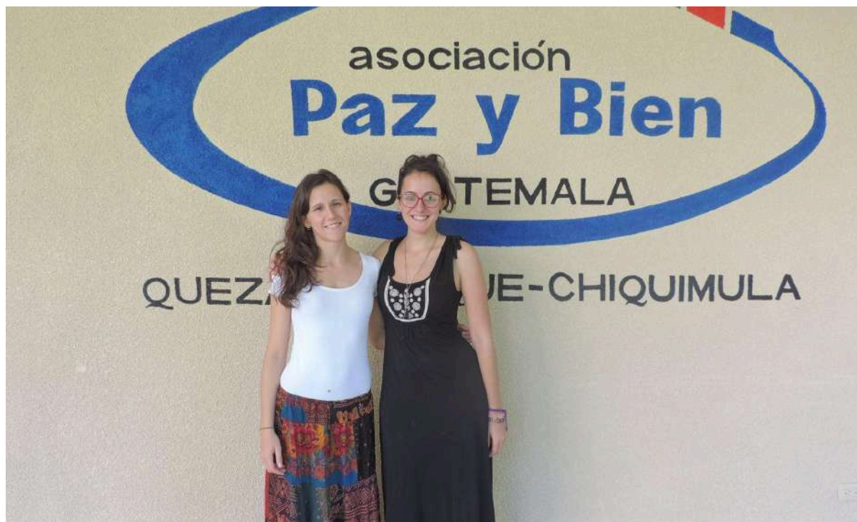
Participantes en el Programa de Voluntariado en Guatemala, 2021.

¿En qué fecha se realiza la convocatoria y se abre el período de inscripción? Su programa de voluntariado internacional está abierto de manera permanente.