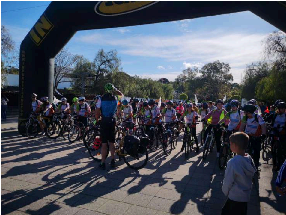
Salida de la primera etapa del reto solidario "Hoy Pedaleo por Ti 2025".

En el curso académico 2023/2024 iniciaron el proyecto "Hoy Camino Por Ti". Su objetivo era unir a pie en tan solo 3 días las 4 localidades que integran el colegio: Valdellarco, Castaño del Robledo, La Nava y Fuenteheridos. Se trata de unos 40 km que el alumnado de 1º y 2º de la Enseñanza Secundaria Obligatoria (ESO) realizó en mayo de 2024, caminando por la red de senderos del Parque Natural Sierra de Aracena y Picos de Aroche. Durante el recorrido por estos pueblos recaudaron fondos para colaborar con la Asociación Yala, que ayuda a niñas de Tánger (Marruecos), asegurando su escolarización y continuidad en la educación, especialmente a aquellas con pocos recursos. Así, la meta del proyecto es garantizar que tengan acceso a la educación y a las oportunidades que merecen. Aprovecharon el pasado puente por el Día de Andalucía para viajar a Marruecos y conocer a las niñas de la Asociación Yala. Como se puede leer en la publicación realizada el 05/03/2025 en la página de Facebook del colegio: