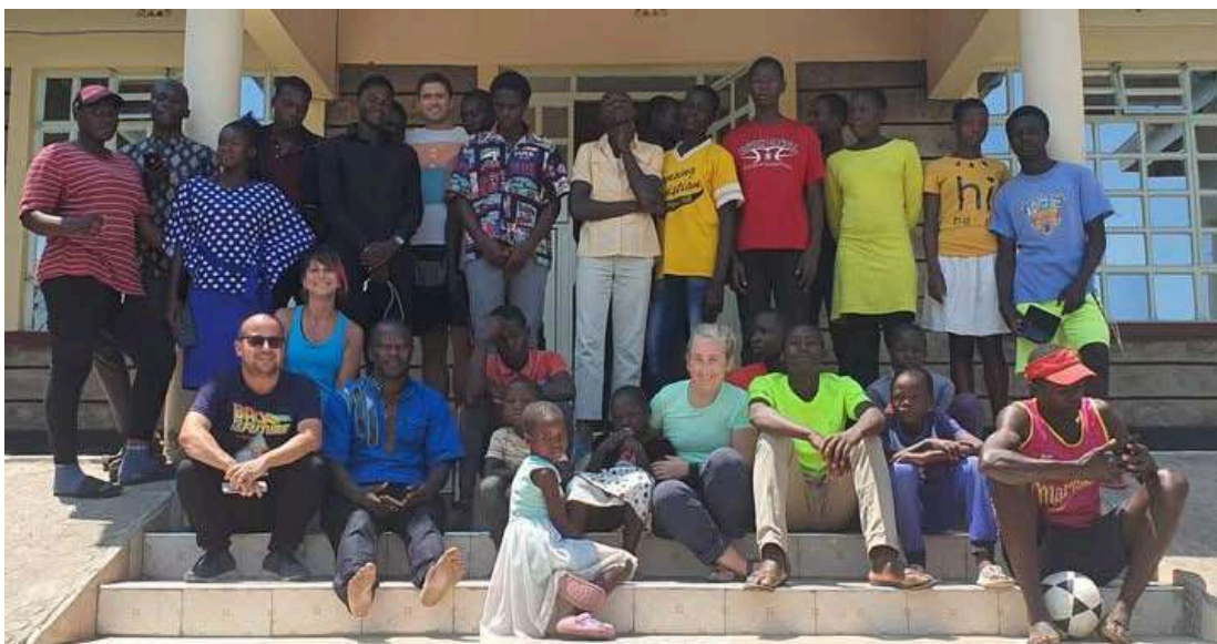
Participantes en el CTM de Kenia, 2022.

https://www.youtube.com/watch?v=REtBG9oKAE