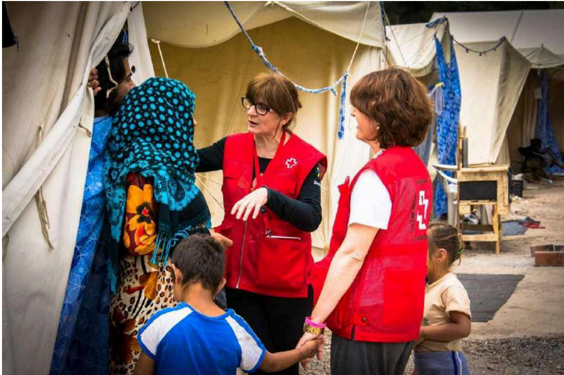
Actividades de cooperación internacional al desarrollo de Cruz Roja Española.

¿En qué fecha se realiza la convocatoria y se abre el período de inscripción? Depende de la convocatoria, en función de las necesidades de la intervención que se vaya a realizar. Dicha convocatoria es publicada en la página web de Cruz Roja Española y se difunde a través de las distintas oficinas territoriales.