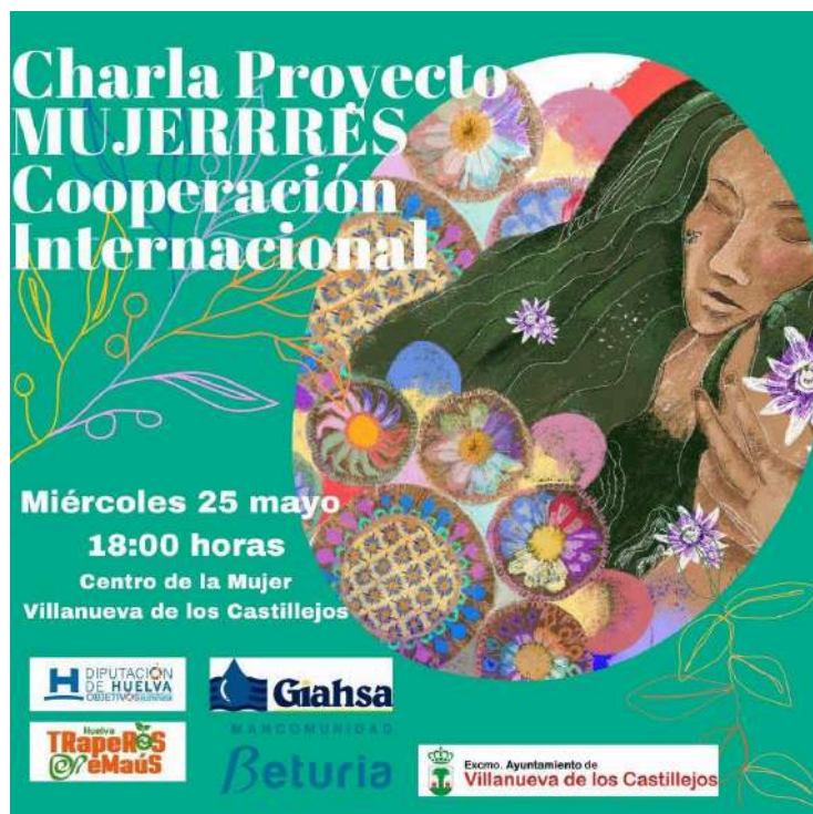
Actividad de difusión del proyecto MUJERRES en Villanueva de los Castillejos, 2022.

Desde Abajo Bañado Sur. Paraguay https://www.youtube.com/watch?v=ClN0FPvEwxk