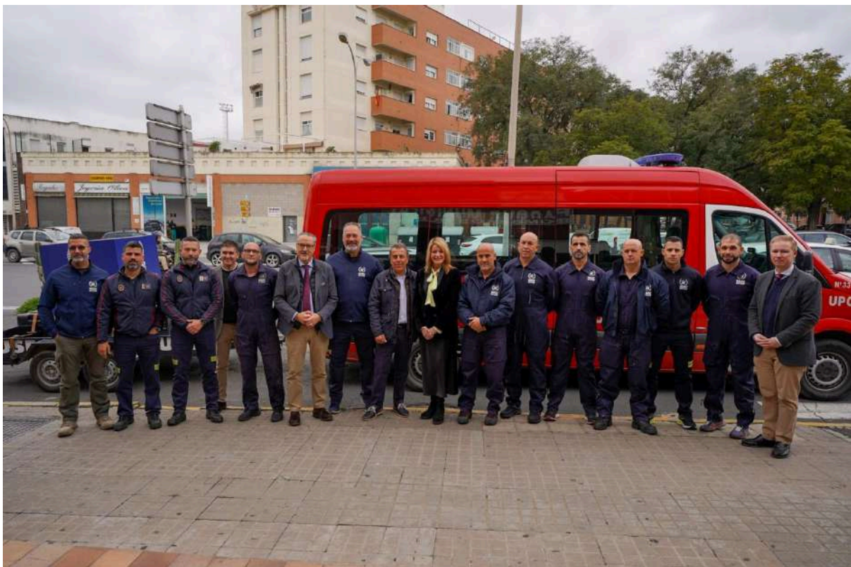
Despedida del grupo que se desplaza a Ecuador para un proyecto de cooperación internacional ante catástrofes naturales, 12/03/2025.