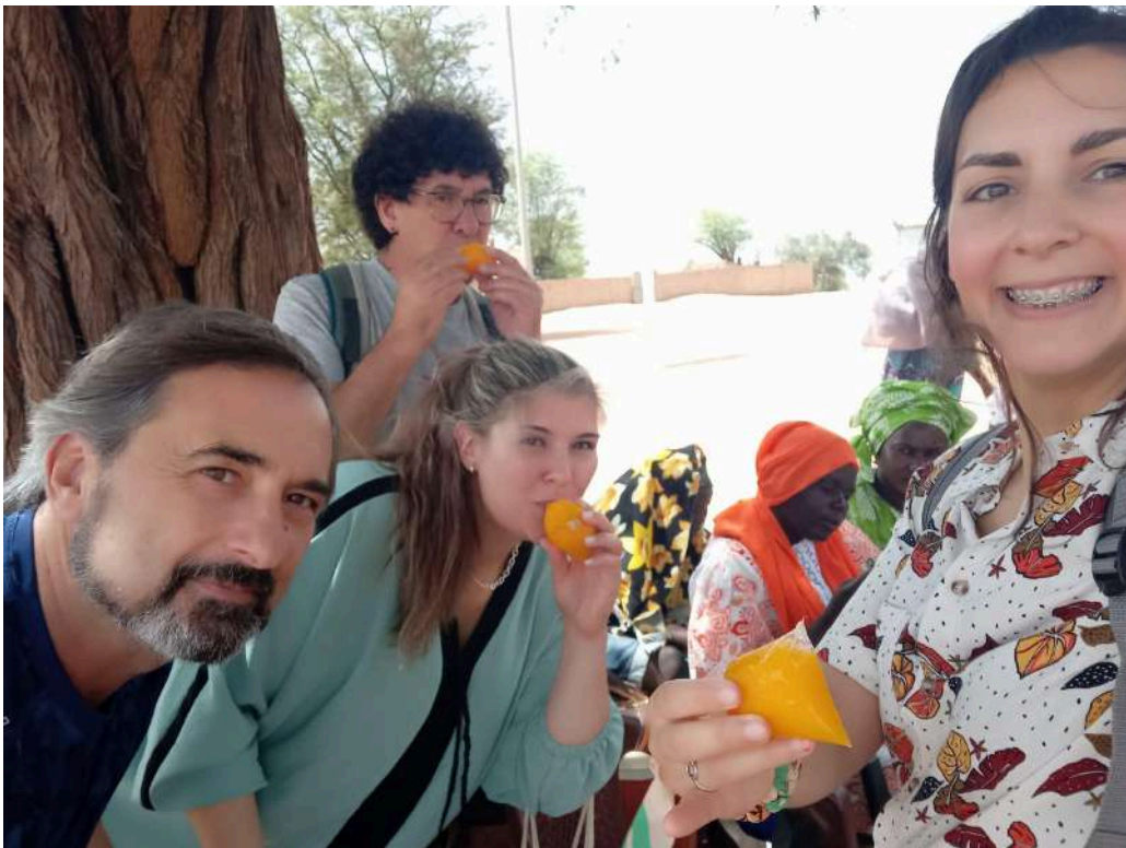
Participantes en el Programa de Voluntariado Internacional, 2024.

Nº de plazas ofertadas: inicialmente serán 4, 1 persona de cada uno de los municipios onubenses participantes. No obstante, la Comisión de Selección podrá ampliar ese número si se dan las circunstancias a nivel de recursos y de necesidades del proyecto.