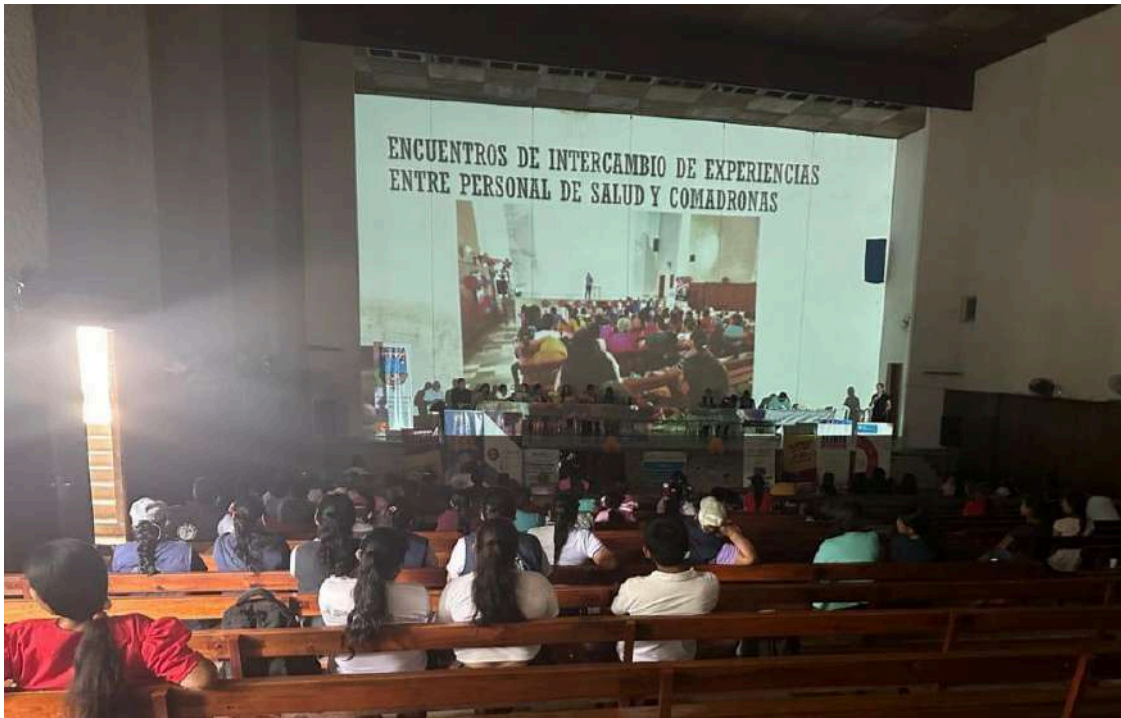
Plan de formación a residentes y estudiantes guatemaltecos del programa de IBERMED, 2024.