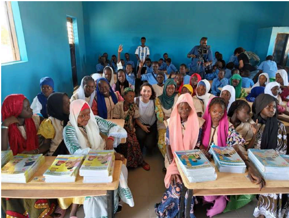
Actividades del Programa de Voluntariado Internacional, 2024.

¿En qué fecha se realiza la convocatoria y se abre el período de inscripción? En el mes de febrero, publicándose la convocatoria en la web y redes sociales de cada uno de los Ayuntamientos participantes.