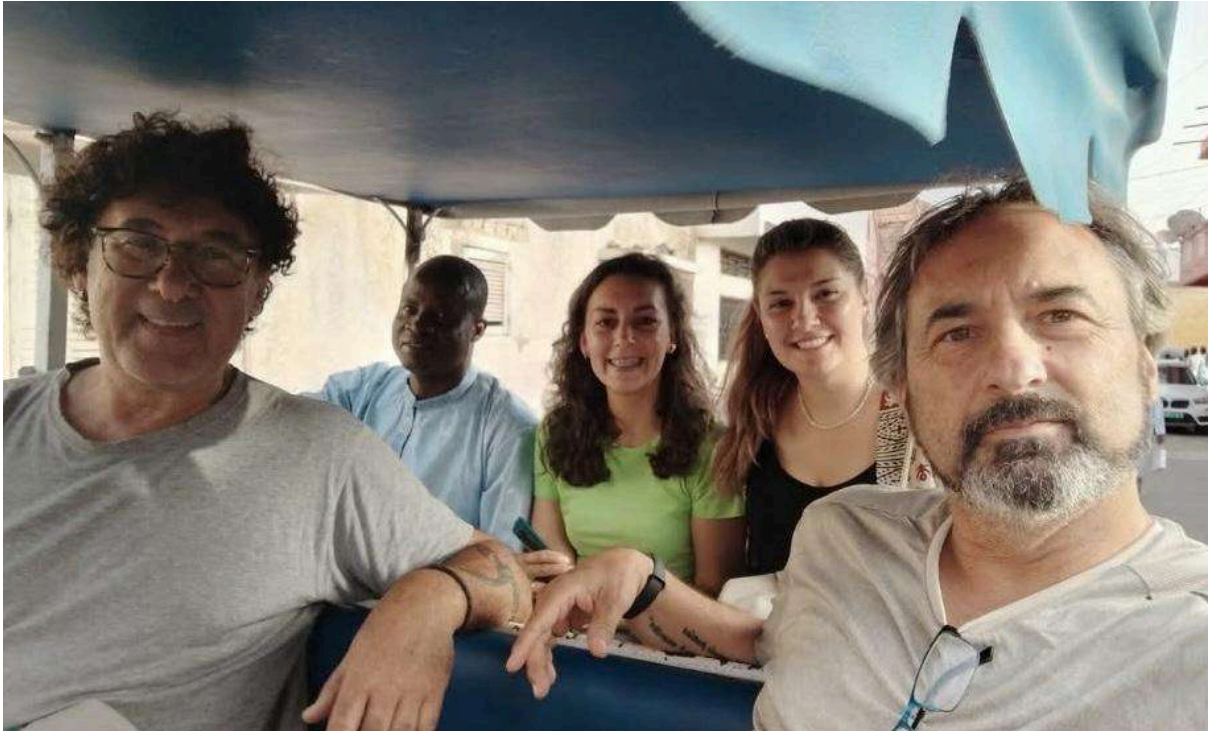
Compañeras/os del programa de voluntariado de Fefe. Fuente: Facebook del Ayuntamiento de Valverde del Camino, 23/07/2024.

manteniendo el contacto, quedando en diversas ocasiones con motivo de actividades de cooperación internacional, y también solo por verse.