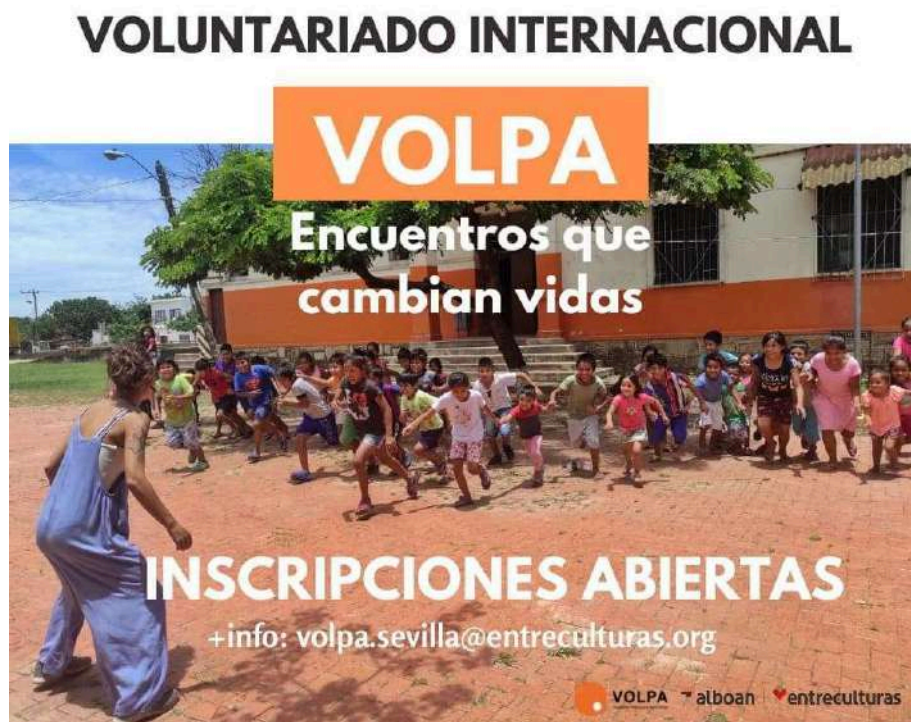
Campaña de difusión de VOLPA, 2022.

Ámbito geográfico: América Latina, África y Asia.