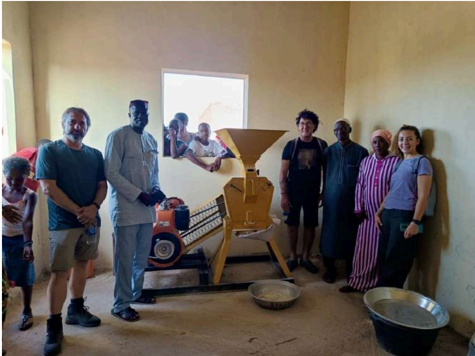
Actividades del Programa de Voluntariado Internacional, 2024.