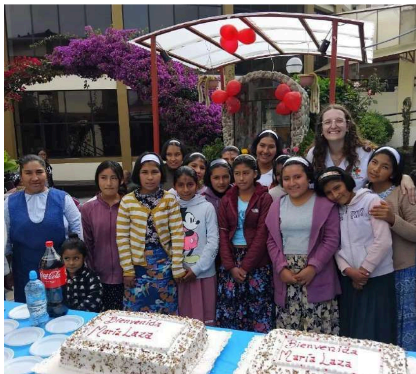
Bienvenida a médica participante en el Programa de Voluntariado Internacional de Madre Coraje en la Clínica Santa Tereza de Abacay (Perú), 2024.