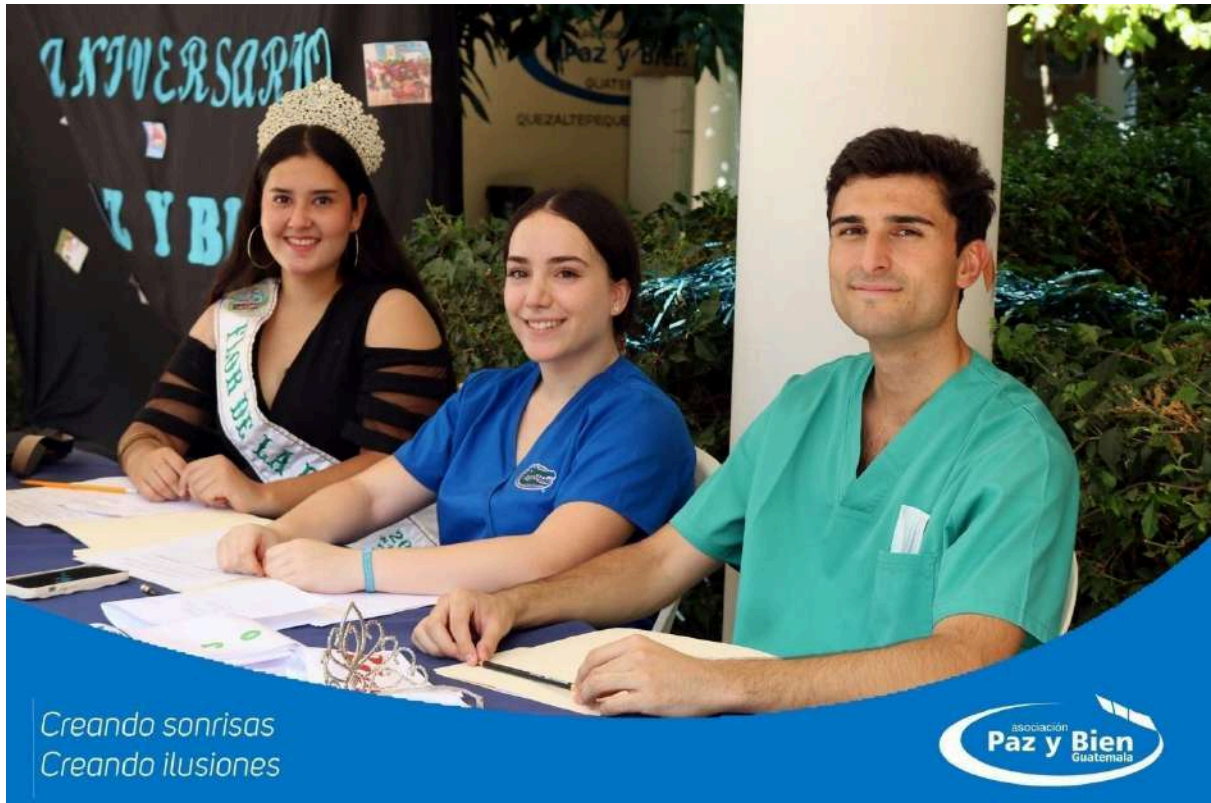
Celebración del 17 aniversario de Paz y Bien Guatemala, 2024.