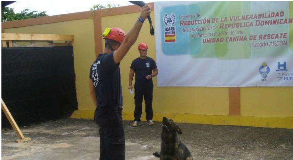
Actividad de formación en República Dominicana de la UCR, 2023.