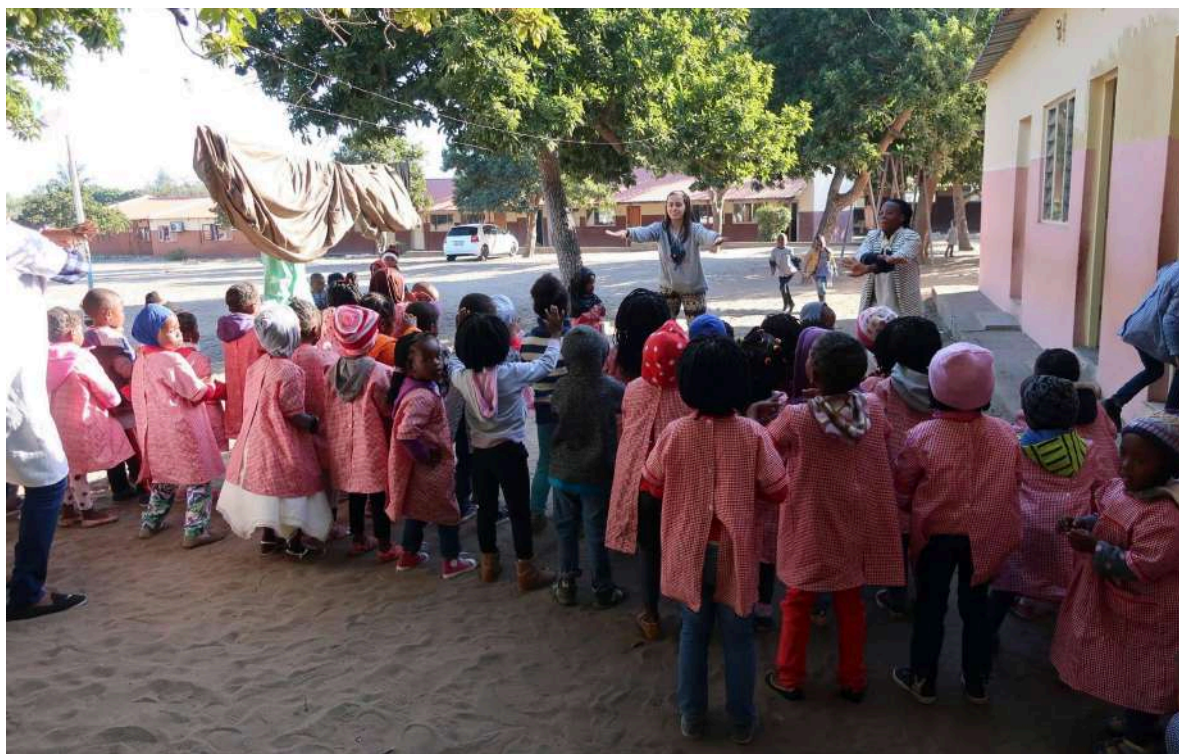
Actividades con niños y niñas en el CTM de Manhiça (Mozambique), 2019.

También se puede hacer la solicitud desde el formulario disponible en el sitio https://sed-ongd.org/haztevoluntario/