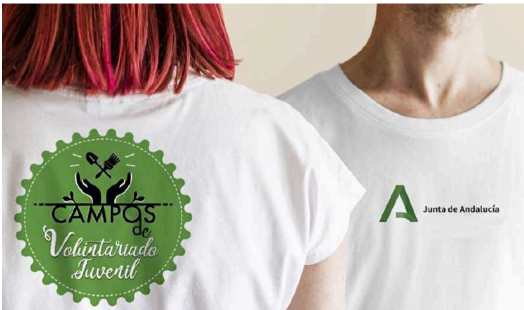
Promoción de los Campos de Voluntariado Juvenil del IAJ, 2025.

Duración y tiempo de dedicación: la duración aproximada es de 15 días, pero dependerá del Campo en concreto que realices. El trabajo se efectúa durante un período diario que oscila entre 5 y 8 horas.