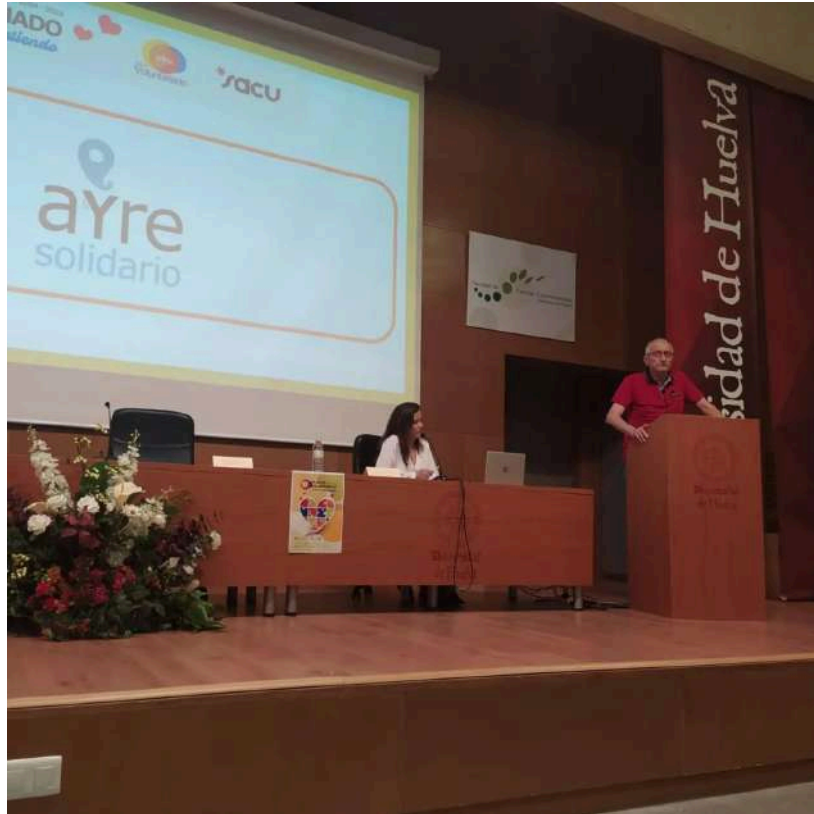
Difusión por Ayre Solidario de su programa de voluntariado internacional, en la Universidad de Huelva.