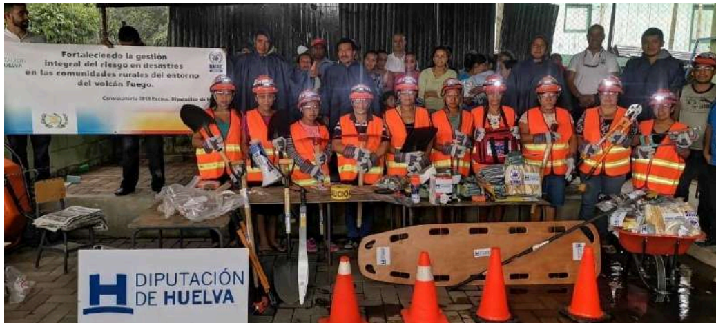
Actividad de formación en Guatemala, 2018.

Ámbito geográfico: Red iberoamericana de BUSF en proyectos de cooperación (Guatemala, Nicaragua, Rep. Dominicana, Ecuador, Perú y Bolivia).