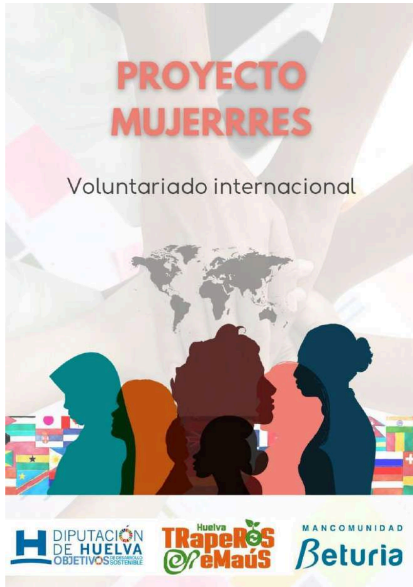
Campaña de difusión del Programa de Voluntariado Internacional en Paraguay, 2023.