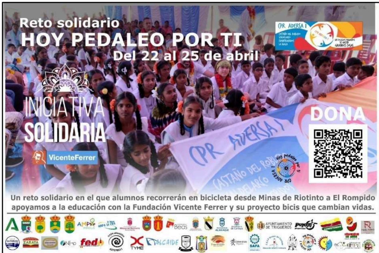
Cartel del reto solidario "Hoy Pedaleo por Ti 2025".