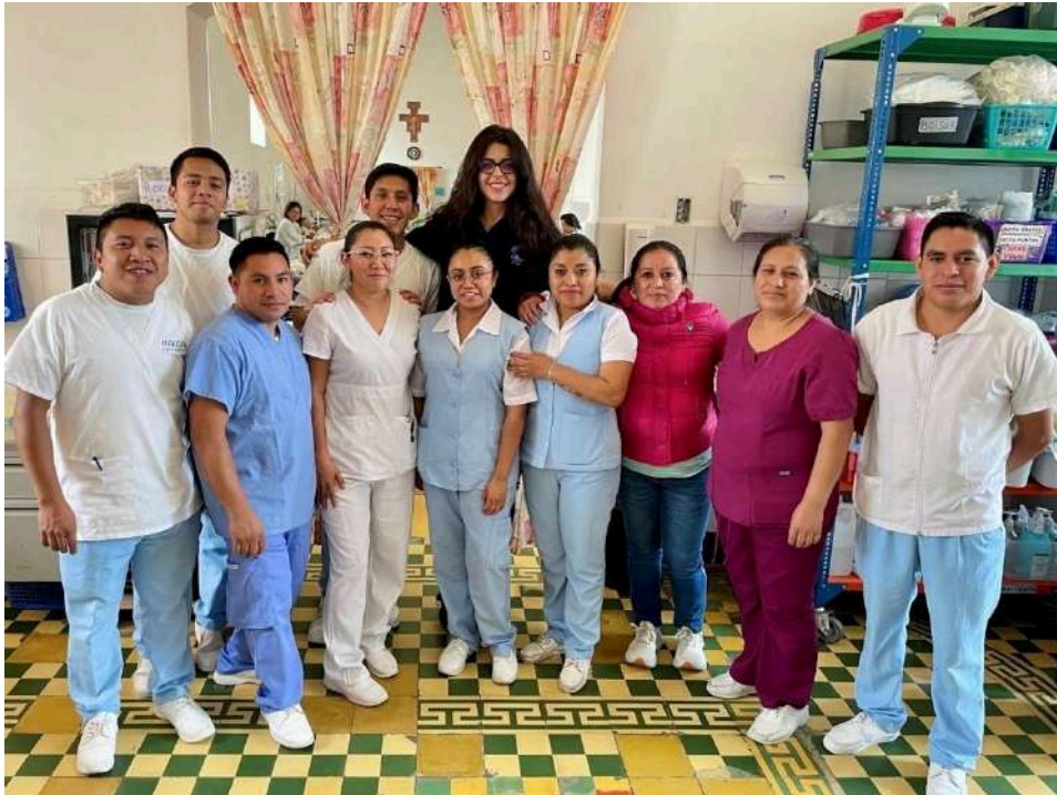
Plan de formación a residentes y estudiantes guatemaltecos del programa de IBERMED, 2024.

¿En qué fecha se realiza la convocatoria y se abre el período de inscripción? Su programa de voluntariado internacional está abierto de manera permanente. Los/as responsables de IBERMED informan de las actuaciones a llevar a cabo en terreno en las reuniones que periódicamente tienen los/as socios/as.