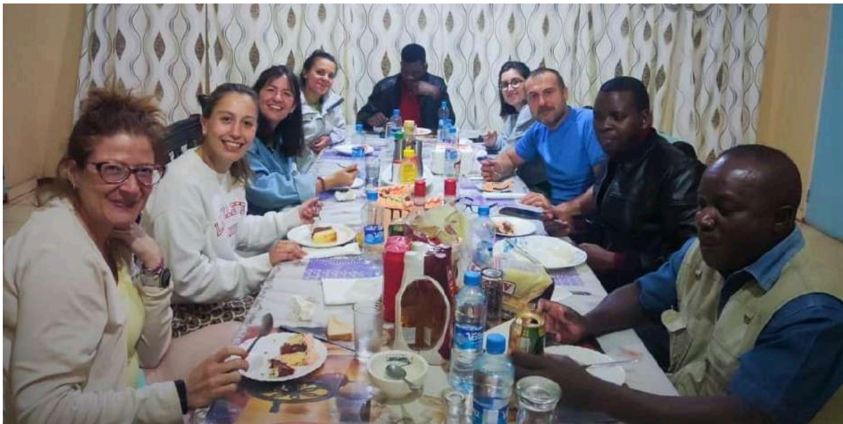
Participantes en el CTM de St. Pauls y Chibuluma (Zambia), 2023.

El país de destino dependerá de las necesidades de las organizaciones locales y del perfil de la persona voluntaria.