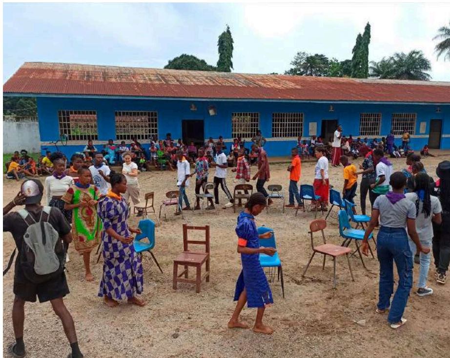
Actividades del programa de voluntariado en Mali.

Cada año la entidad contacta con las contrapartes en terreno y, dependiendo de su disponibilidad para acoger y del perfil necesario en función de las actividades y/o proyectos que tengan en funcionamiento, buscan a las personas voluntarias que reúnan estas características y tengan la formación y la experiencia adecuadas para participar en este proyecto.