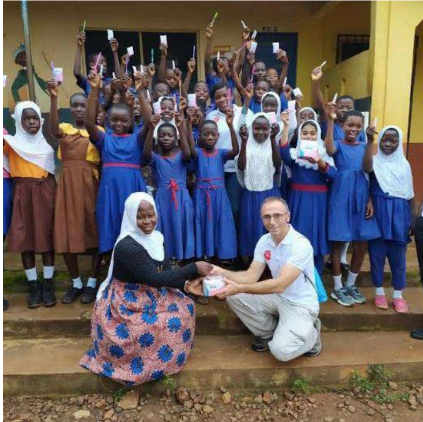
Participante en el Programa de Voluntariado en Ghana, 2021.