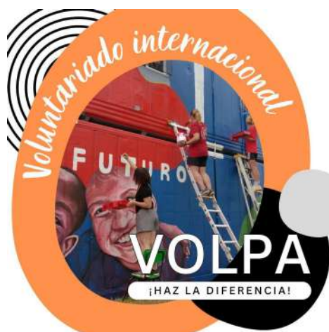
Campaña de difusión de VOLPA, 2023.

https://www.youtube.com/watch?v=f5pRNlasHEk