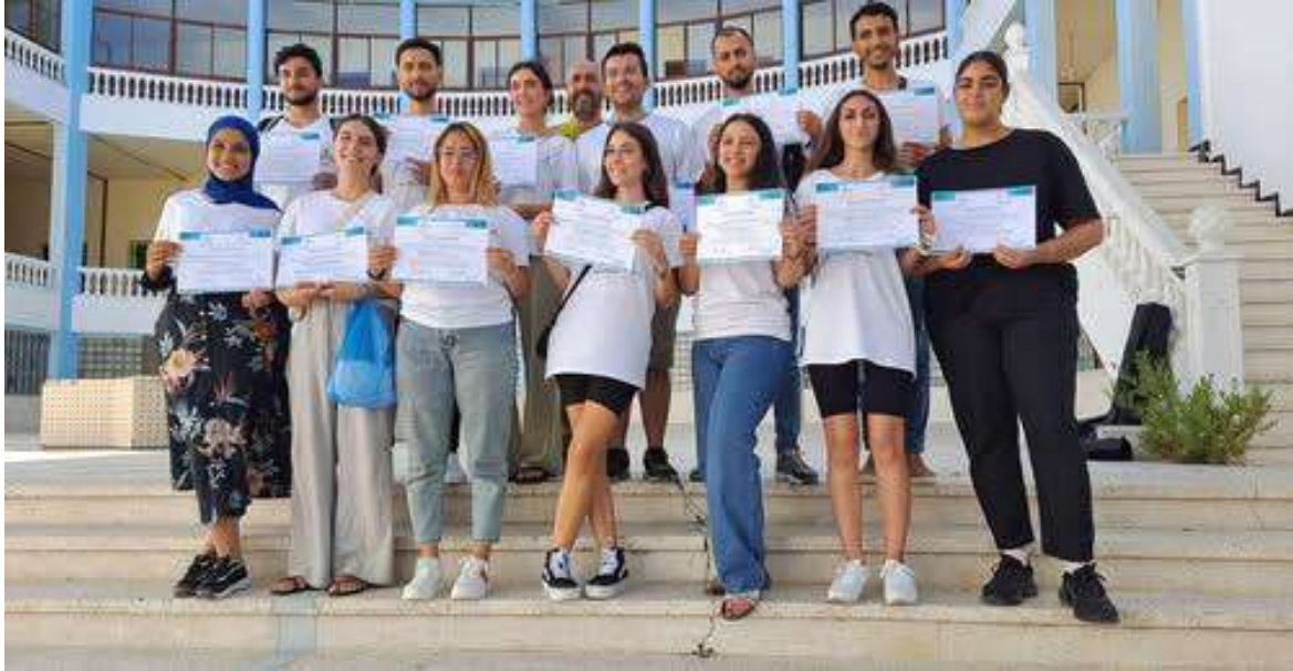
Participantes en el Programa de Voluntariado Internacional de Ayre Solidario, 2023.