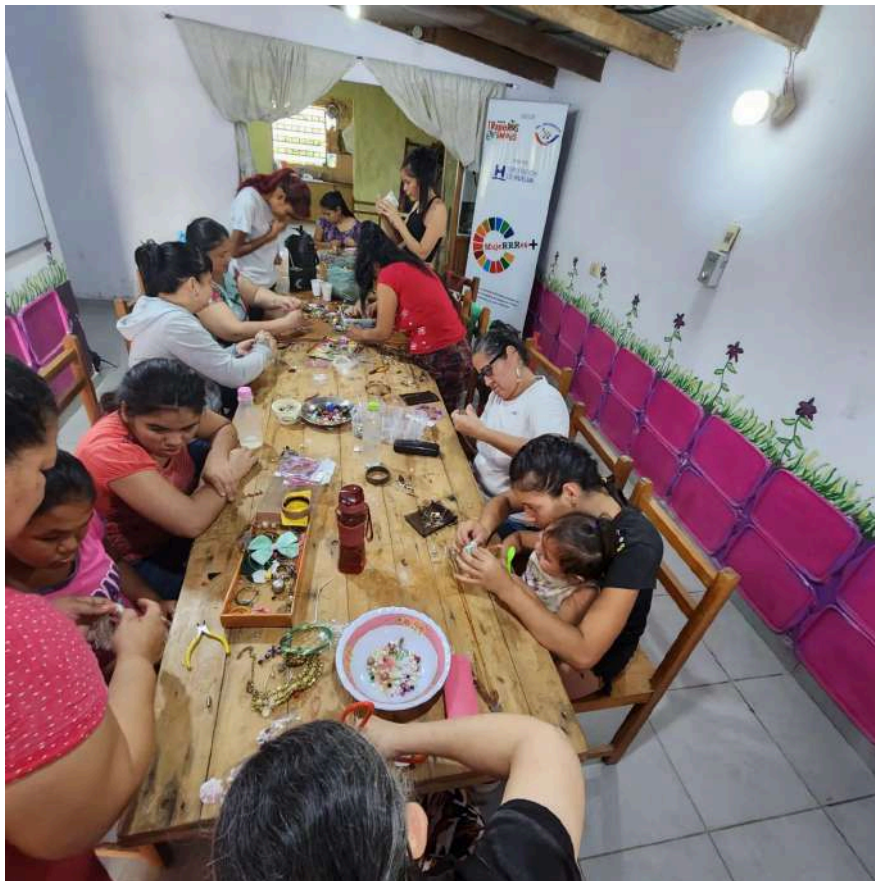
Actividad del proyecto MUJERRES en Paraguay, 2023.

El acta con la resolución del proceso de selección se publica en la página web de la Mancomunidad.