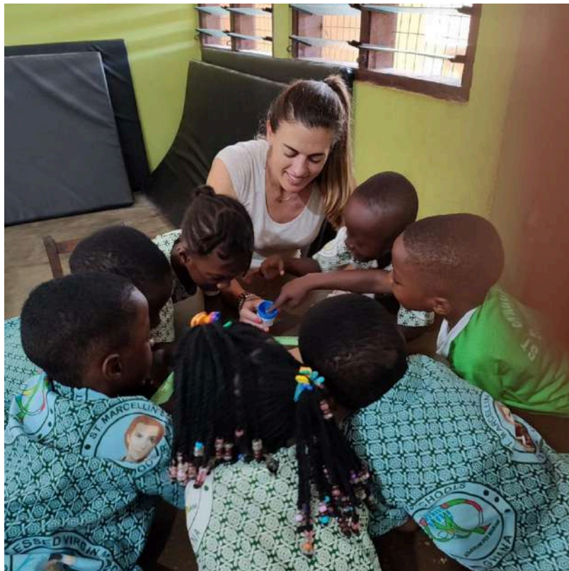
Participante en el CTM de Ghana, 2023.

La persona voluntaria debe hacer una aportación económica de 150,00 € para cofinanciar los gastos de alojamiento y manutención, y de 400,00 € para los gastos del viaje de ida y regreso al país en el que se va a llevar a cabo la actividad en terreno.