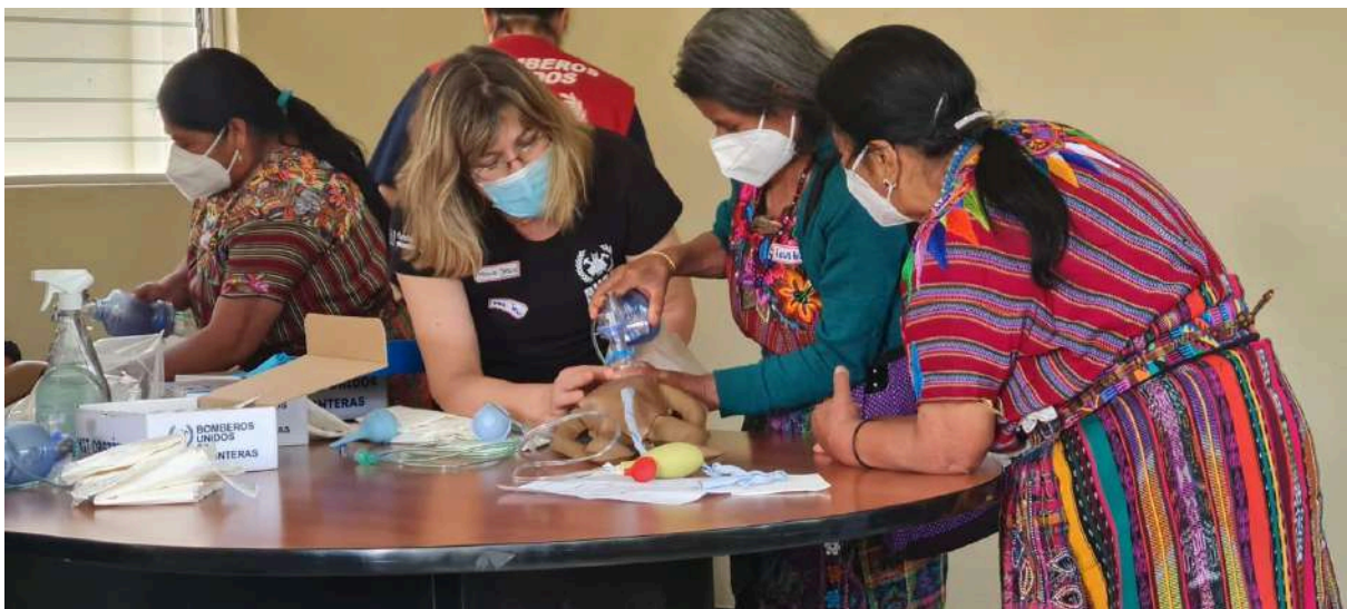
Actividad de formación en Guatemala por la UMA, 2018.

Experiencia en terreno. ¿Cuándo se realiza? Durante todo el año.