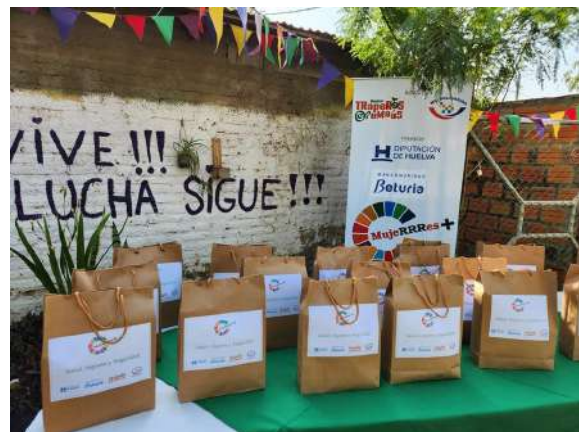
Actividad en Paraguay de cierre del proyecto MUJERRRES+, 2023. Fuente: Facebook de Asociación Mil Solidarios, 29/09/2023.

Titularidad (pública o privada): mixta, pública y privada.