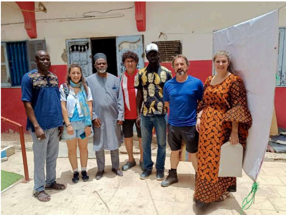
Actividades del Programa de Voluntariado Internacional, 2024.

Sí, las personas voluntarias seleccionadas conocerán el conjunto de actuaciones que realiza el proyecto y el trabajo que realiza en la provincia CONVIVE Fundación Cepaim. Se considera la primera fase del programa de voluntariado. Se desarrollará la última semana del mes de mayo.