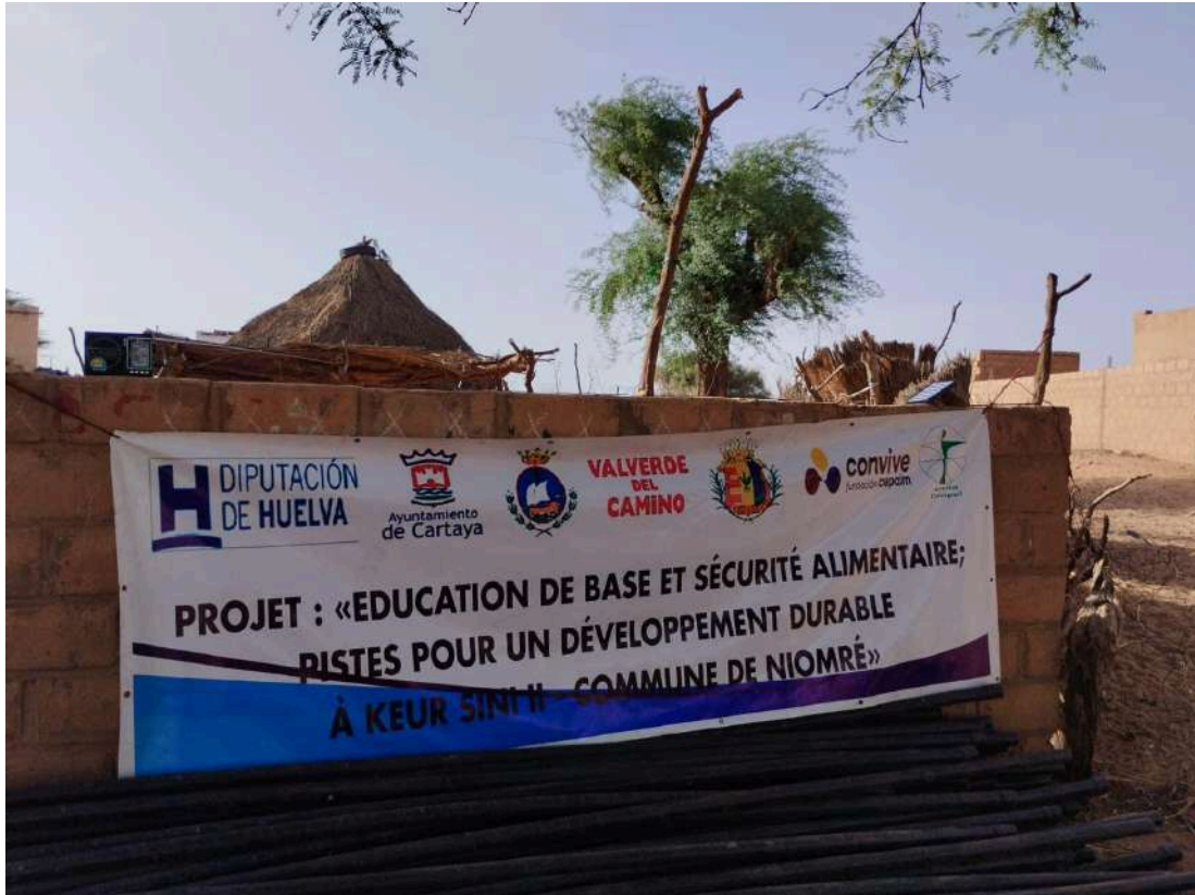
Lona publicitaria del proyecto, 2024.

Durante la estancia en Senegal, las personas voluntarias tendrán una persona de referencia que se encargará de toda la logística del programa.