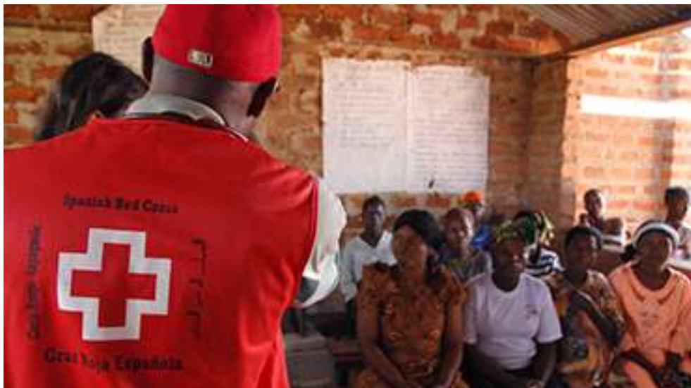
Actividades de cooperación internacional al desarrollo de Cruz Roja Española.