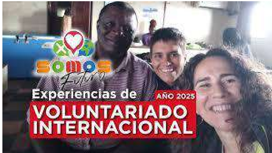
Difusión del programa, 2025.