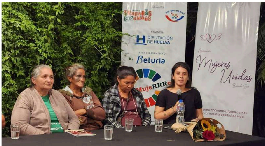
Actividad en Paraguay de presentación de publicación del proyecto MUJERRES+, 2023.