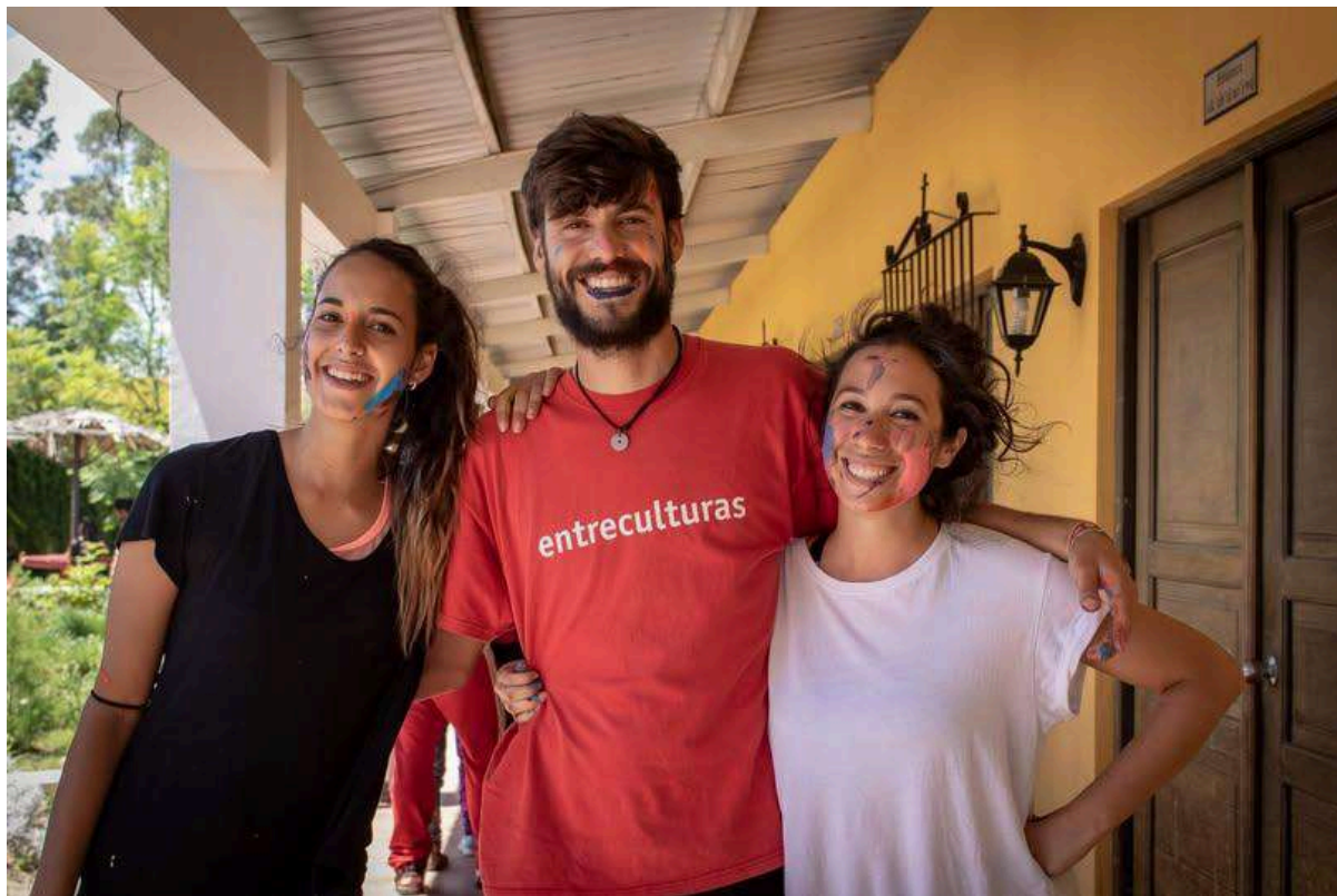
Participantes en VOLPA, 2024.

Se trata de una formación exhaustiva y grupal para identificar las motivaciones de las personas voluntarias, conocer y profundizar en las causas de la desigualdad global, y adquirir y fortalecer herramientas para el encuentro intercultural. Además hay un “mentoring” individualizado antes, durante y después de la experiencia en terreno.