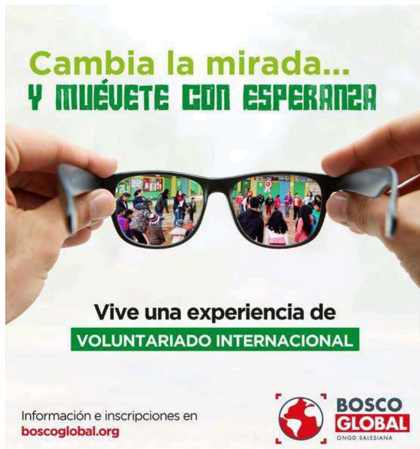
Campaña de promoción del programa de voluntariado, 2022.