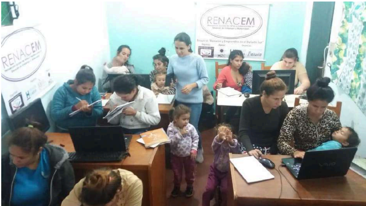
Actividad de las participantes en el Programa de Voluntariado Internacional en Paraguay, 2019.

Breve presentación de las entidades. Finalidad: estamos ante el proyecto de cooperación al desarrollo “MUJERRRES +”, el cual tiene como objetivo dignificar el trabajo de las mujeres recicladoras del Bañado Sur de Asunción (Paraguay), ofreciéndoles espacios de formación y equipos de protección para el reciclado seguro. Dicho proyecto es fruto de la colaboración de una asociación de municipios (Mancomunidad de municipios Beturia, integrada por los Ayuntamientos de Alosno, Cartaya, El Almendro, El Granado, Puebla de Guzmán, San Bartolomé de la Torre, San Silvestre de Guzmán, Sanlúcar de Gadiana, Santa Bárbara de Casa, Villablanca y Villanueva de los Castillejos), una administración provincial como es la Diputación de Huelva, y una asociación (Traperos de Emaús de Huelva). A ellas se une como socio local en terreno la Asociación Mil Solidarios.