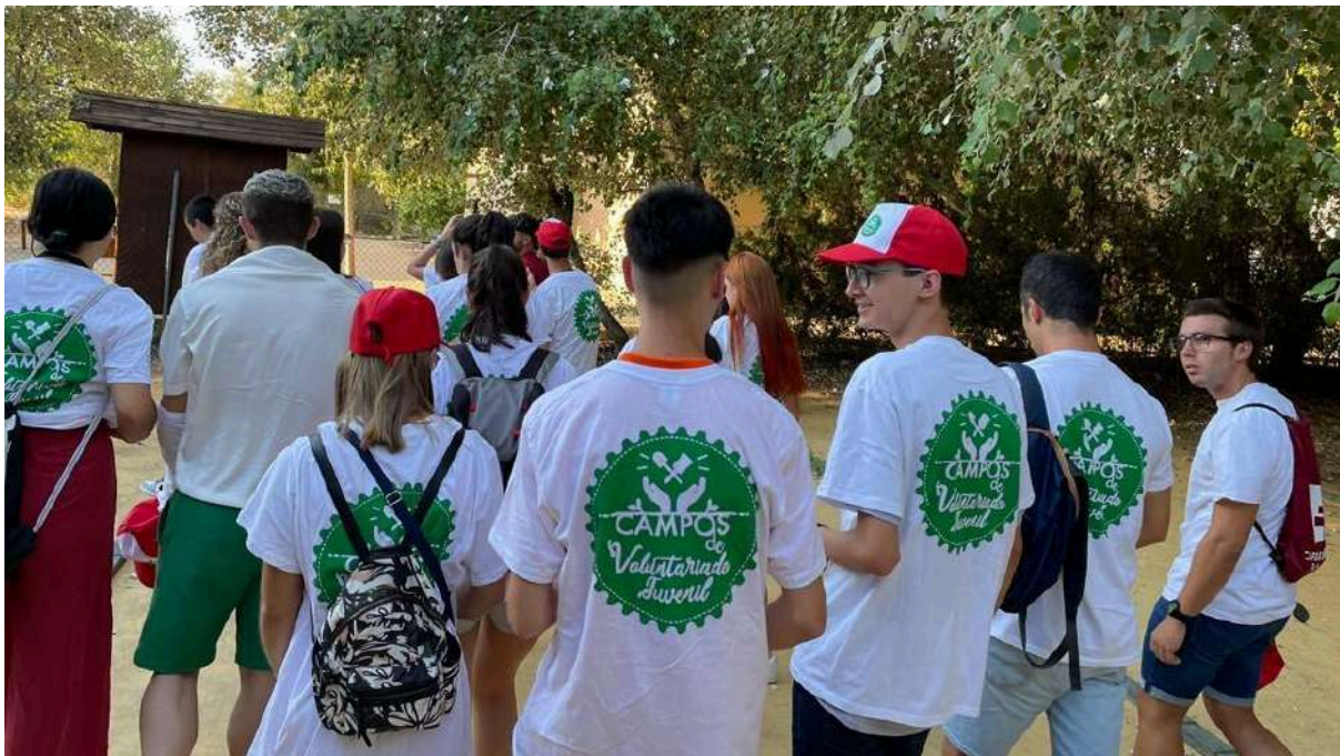
Promoción de los Campos de Voluntariado Juvenil en el Extranjero por el IAJ, 2025.

En algunos casos en los que las personas voluntarias intervienen con menores de edad o con diversidad funcional intelectual, será preciso aportar el Certificado Negativo del Registro Central de Delinquentes Sexuales y Trata de Seres Humanos.