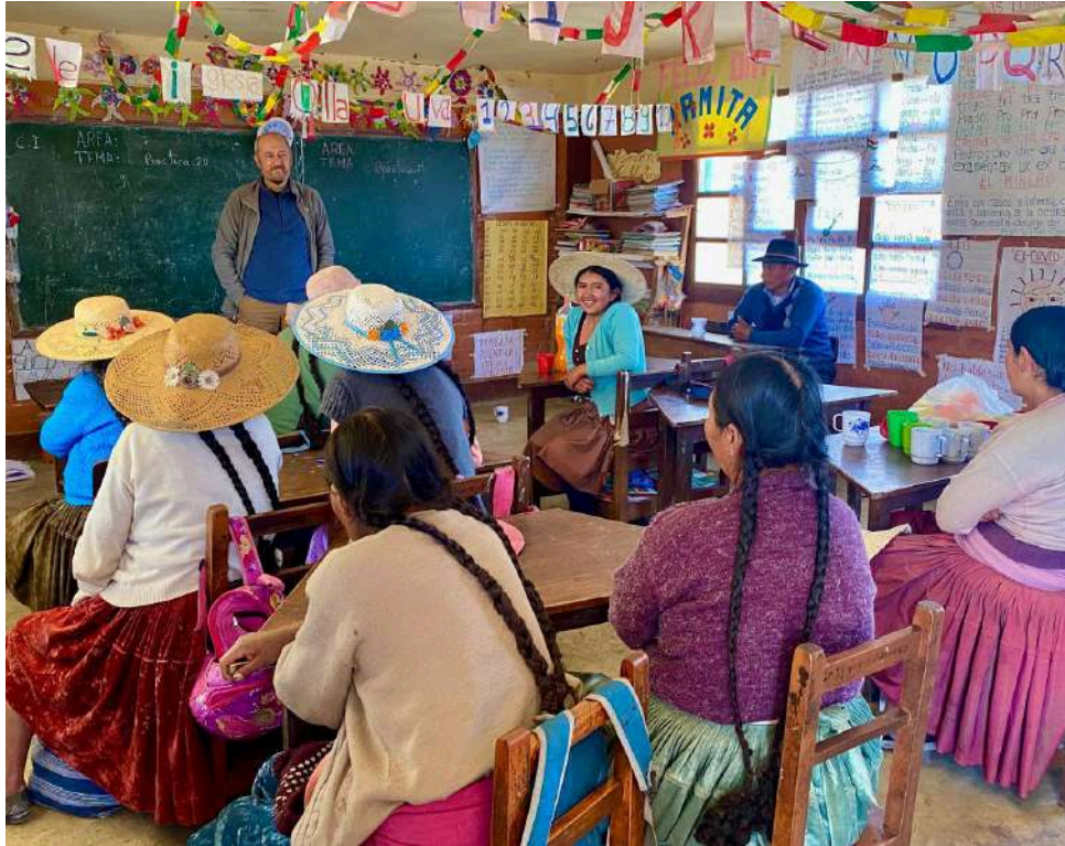
Actividades del programa de voluntariado en Bolivia.