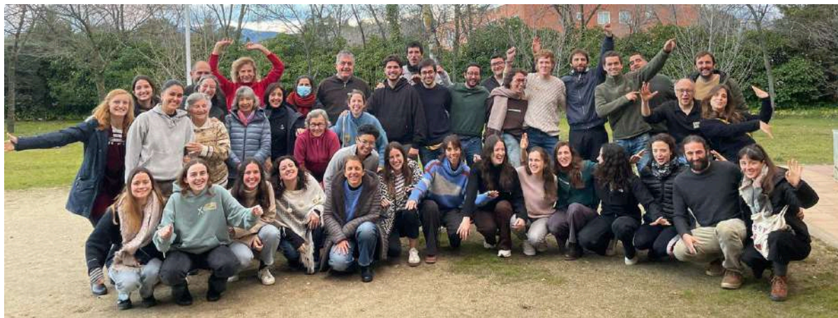
Encuentro estatal VOLPA, enero de 2025.

difícil es dar un seguimiento a estas personas a la vez que se respeta su ritmo de integración y adaptación a una nueva y difícil situación” (Entreculturas, 2014: 26).