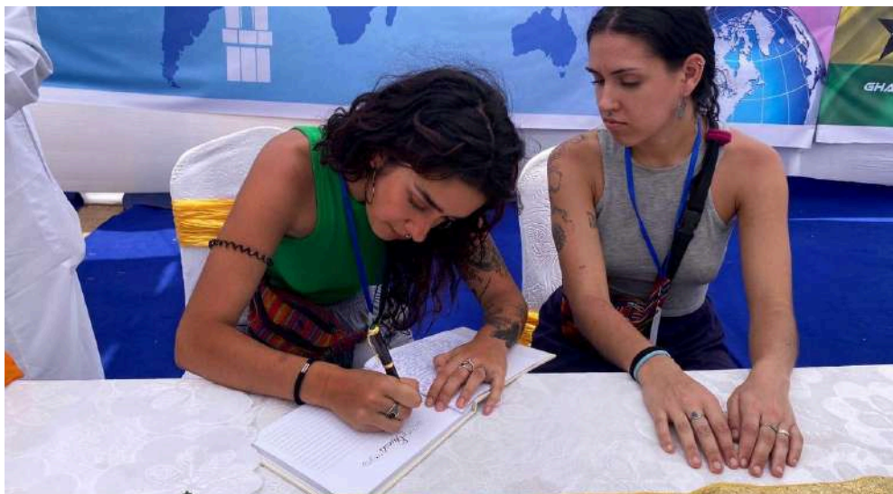
Participantes en el Programa de Voluntariado en Ghana, 2020.

No se contempla, pero es frecuente que se colabore en labores de difusión y sensibilización.