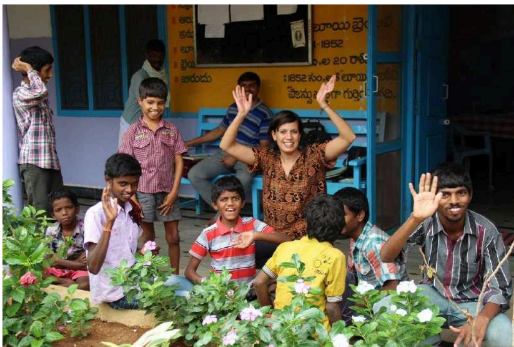
Trabajo de voluntariado en la India de la FVF, 2015.

De acuerdo con la Memoria anual 2023-2024 de la entidad, en ese período contaron con un total de 132 personas voluntarias en la India. La cifra ha experimentado un crecimiento notable, teniendo en cuenta que en el período 2022-2023 fueron 44.