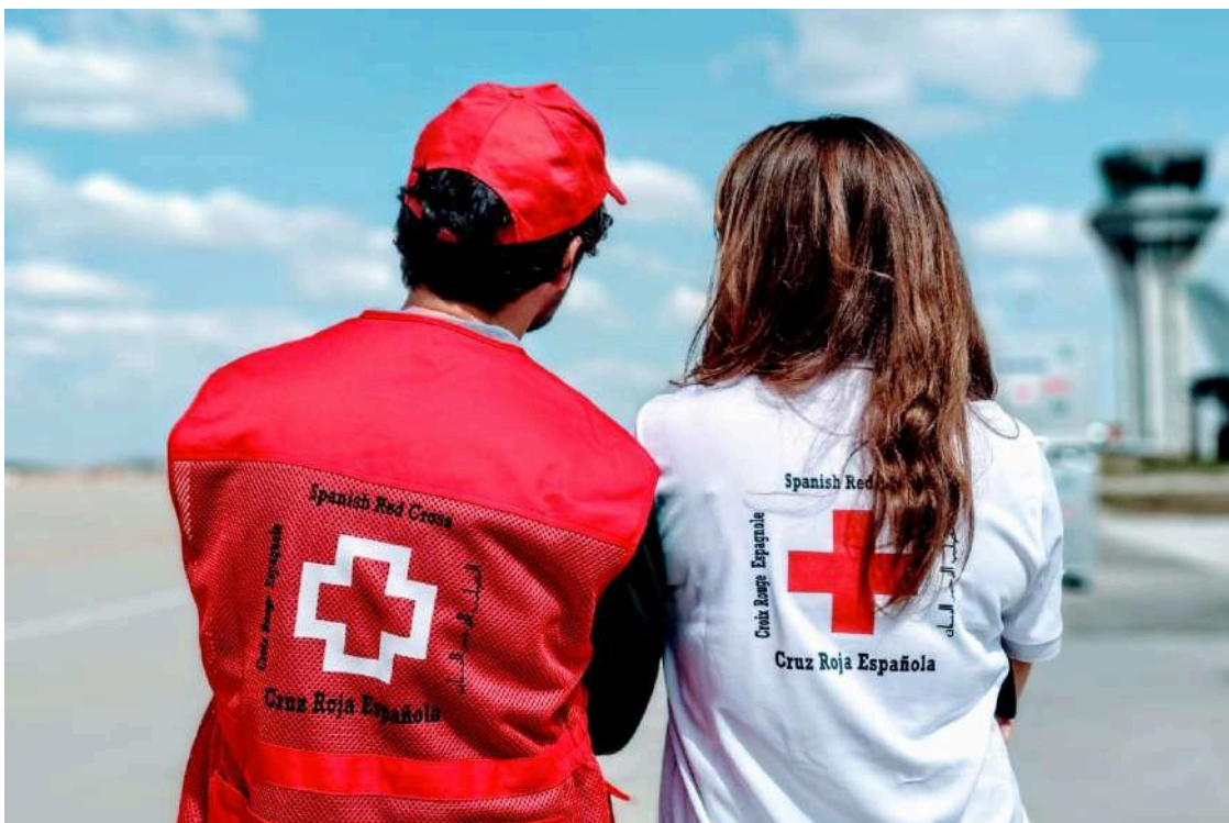
Campaña Voluntariado sin fronteras, 2025.