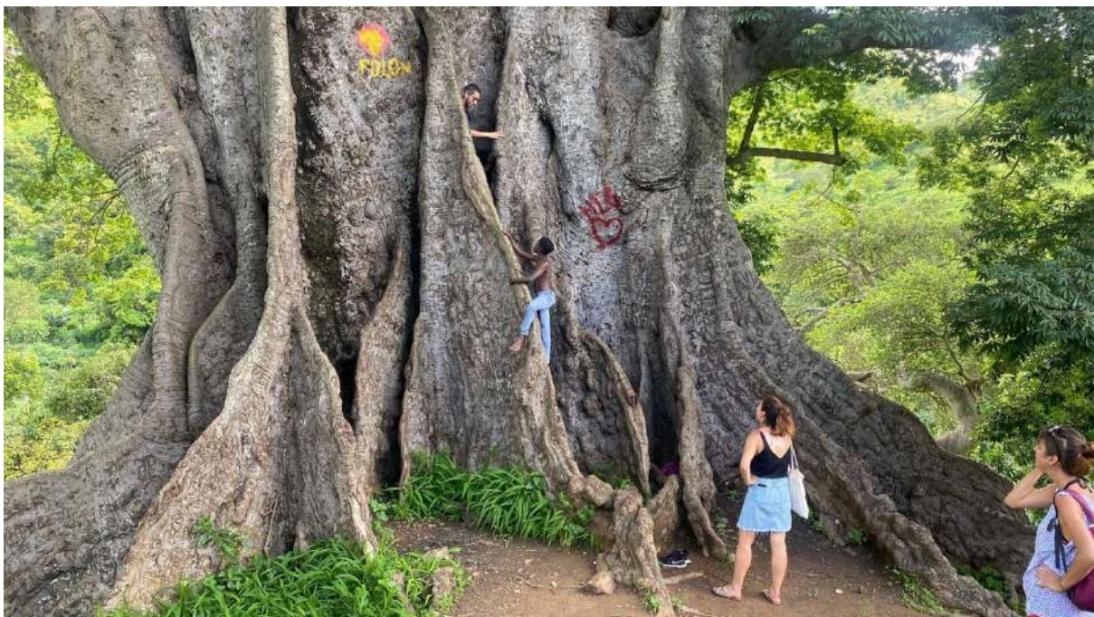
Participantes en actividades de voluntariado en Cabo Verde con ayudas de la UHU, 2021.

En el caso de las ayudas en el marco de los proyectos que ejecuta la UHU financiados por la AACID y la AECID las tareas suelen incluir la colaboración en los programas formativos desarrollados en terreno, toma de datos y elaboración de documentos relacionados con el proyecto u otras acciones de cooperación concertadas con las entidades locales socias de la UHU.