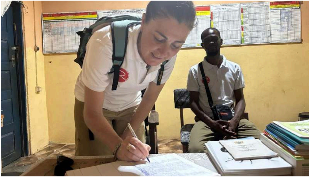
Participante en el Programa de Voluntariado en Ghana con la contraparte local, 2023.