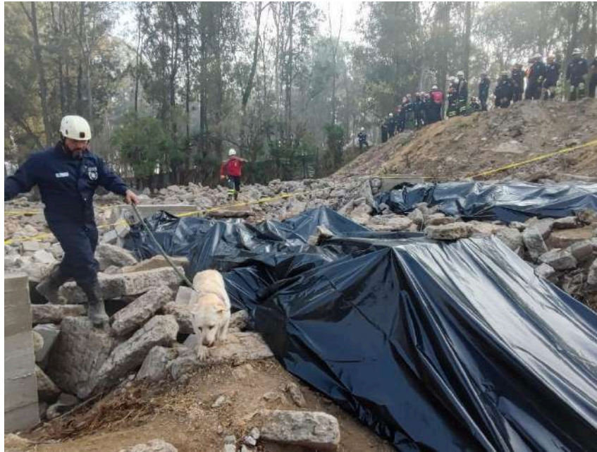
Actividad de formación en Guatemala de la UCR, 2023.