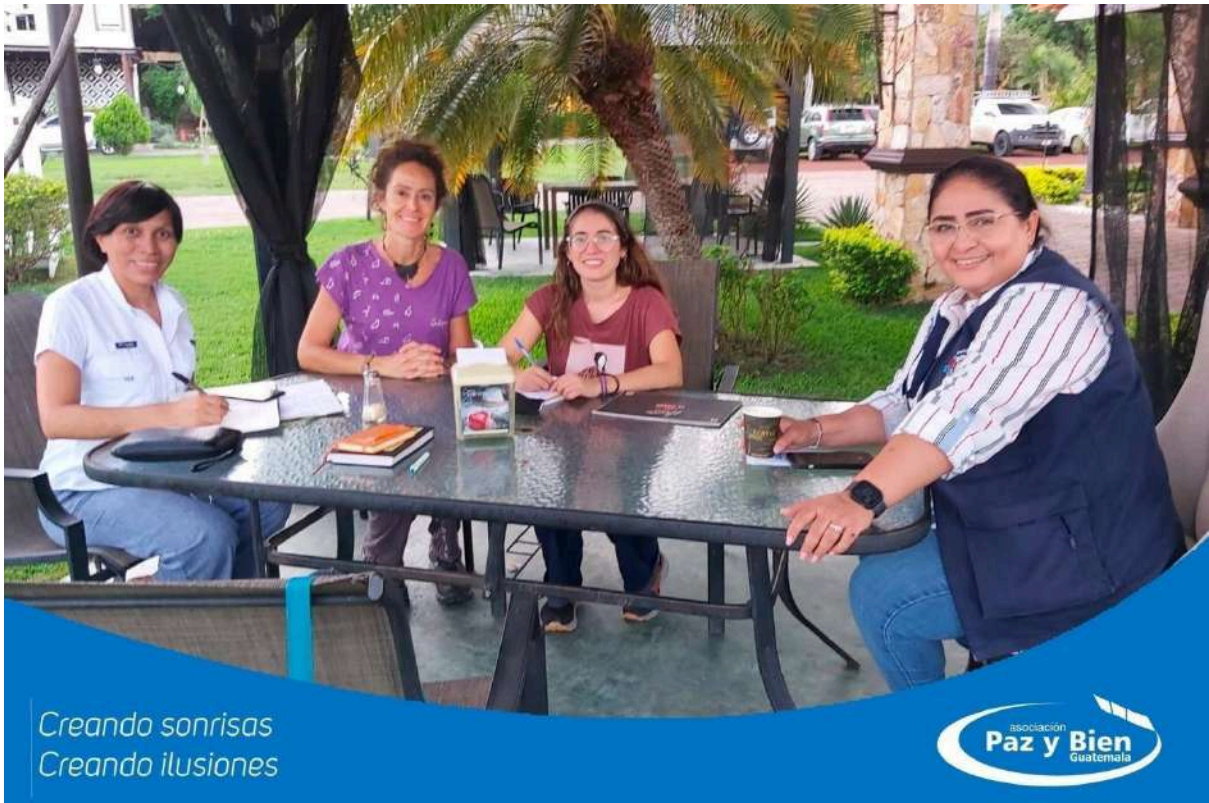
Participantes en el Programa de Voluntariado en Guatemala, 2024.

Titularidad (pública o privada): Privada