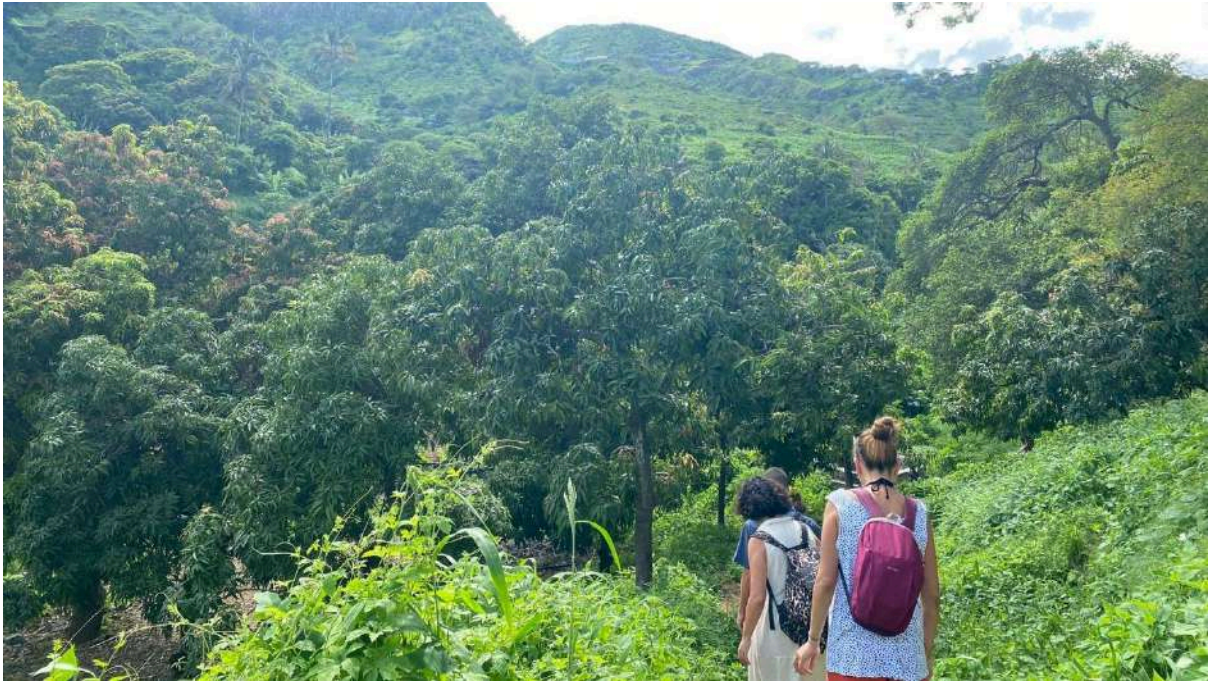
Participantes en actividades de voluntariado en Cabo Verde con ayudas de la UHU, 2021.