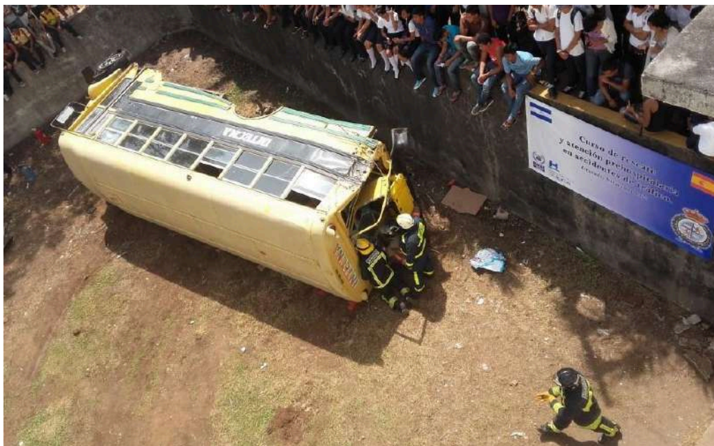
Actividad de formación en Honduras, 2022.

Las personas deberán expresar su interés de ser socio de BUSF a través del cuestionario de solicitud disponible en su web, en concreto en el sitio https://busf.org/solicitud-colaborador/ . Al hacer esta solicitud hay que adjuntar el currículum y los documentos acreditativos de que se cumplen los requisitos profesionales exigidos.