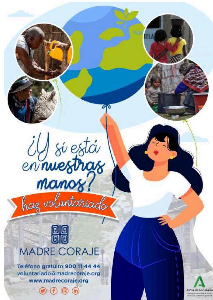
Campaña de difusión del Programa de Voluntariado Internacional de Madre Coraje, 2023.

Durante la experiencia en el programa de voluntariado este/a debe mantener una comunicación fluida con Madre Coraje España y Madre Coraje Perú o Mozambique, según sea el caso. También deberá cumplimentar un informe de evaluación intermedia, además del final.