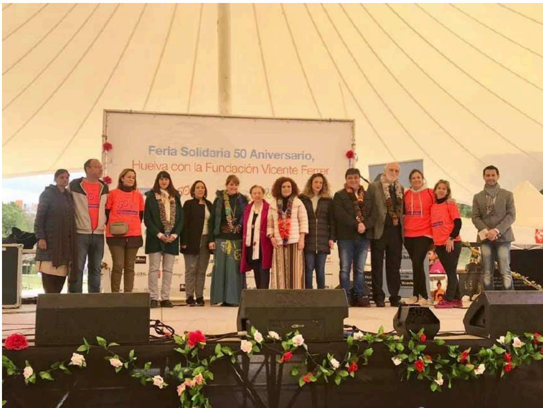
La FVF celebrando en Huelva el 50 aniversario de su nacimiento, 2019.

El horario de trabajo se adapta a las necesidades de la organización, debiéndose tener en cuenta que la semana laboral en la India es de lunes a sábado. El profesorado, en general, imparte 4 horas de clase diarias.