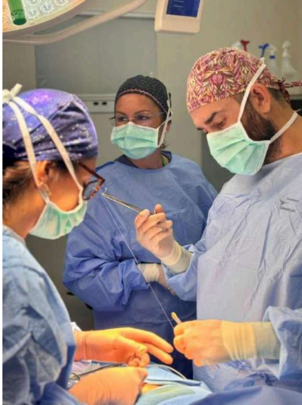
Intervención quirúrgica del programa de IBERMED en Guatemala, 2024.

Nº de plazas ofertadas: va a depender del tipo de actuación a llevar a cabo. El grupo quirúrgico es el más numeroso, de 20 a 30 plazas al año. A ello se suman 4 grupos al año de un máximo de 5 personas, 2 de ellos para atención temprana, y los otros 2 para la lucha contra la enfermedad de chagas.