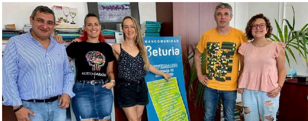
Participantes en el Programa de Voluntariado Internacional en Paraguay, 2022.

El plazo de presentación de solicitudes para participar en este procedimiento se extenderá desde el día de su publicación en la web de la Mancomunidad de municipios Beturia, hasta las 23:59 horas del día que se indica en la convocatoria.