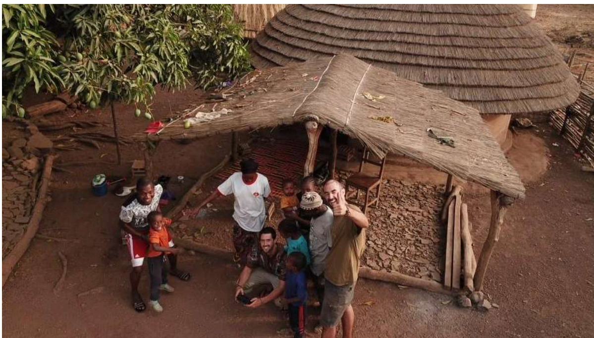
Participantes en actividades de voluntariado en Senegal con ayudas de la UHU, 2019.

El citado Programa cuenta con diversas líneas de trabajo y acciones. Dentro de la “Línea CD1. Sensibilización, educación y formación para el desarrollo” se incluye el conceder “ayudas para la realización de actividades de voluntariado de estudiantes en proyectos de cooperación internacional para el desarrollo” (CD1.3). “Pretende poner en contacto a estudiantes con actuaciones directas en cooperación internacional, colaborando en los trabajos de un proyecto de cooperación en marcha liderado por un agente o entidad con experiencia”. Por su parte, la “Línea CD2. Intervenciones directas en terreno” se refiere a “diferentes proyectos financiados externamente y en países priorizados por la cooperación española y andaluza”. De esta forma a través de las acciones descritas se ofrece al alumnado de la UHU la posibilidad de realizar actividades de voluntariado en proyectos de cooperación internacional.