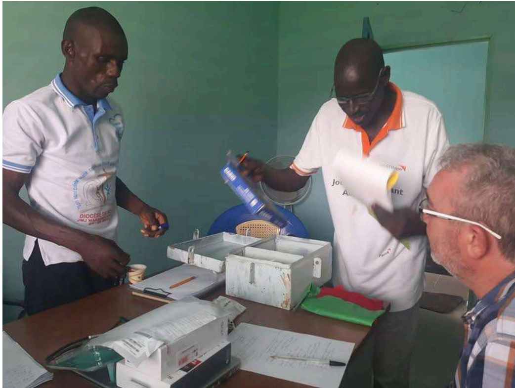
Trabajos de coordinación de IESMALA con la FOCB de Tattanguine, 2022.