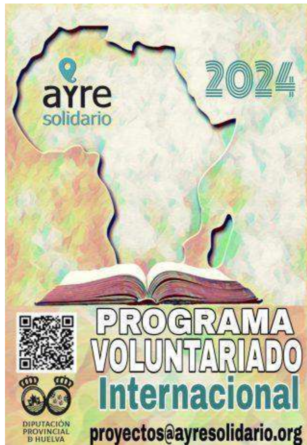
Cartel del Programa, 2024.

La persona voluntaria se comprometerá por escrito a realizar una actividad de sensibilización a la vuelta a España. Tendrá que desarrollarse en cualquier población de la provincia de Huelva y en ella se describirá su actuación y el proyecto en el que se enmarca. Dicha actividad debe llevarse a cabo antes de Navidad. A tal fin podrá recibir la ayuda y asesoramiento de personas de Ayre Solidario para todo lo que necesiten.