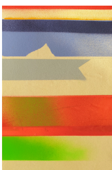
[ /export/sites/dph/cultura/.galleries/imagenes/Arco/2022/Obra_3.jpg ]